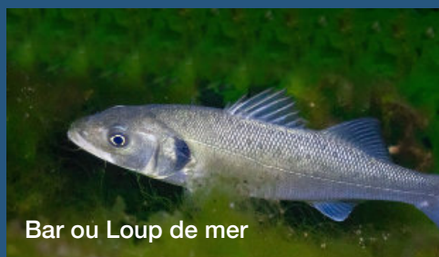
Bar ou Loup de mer